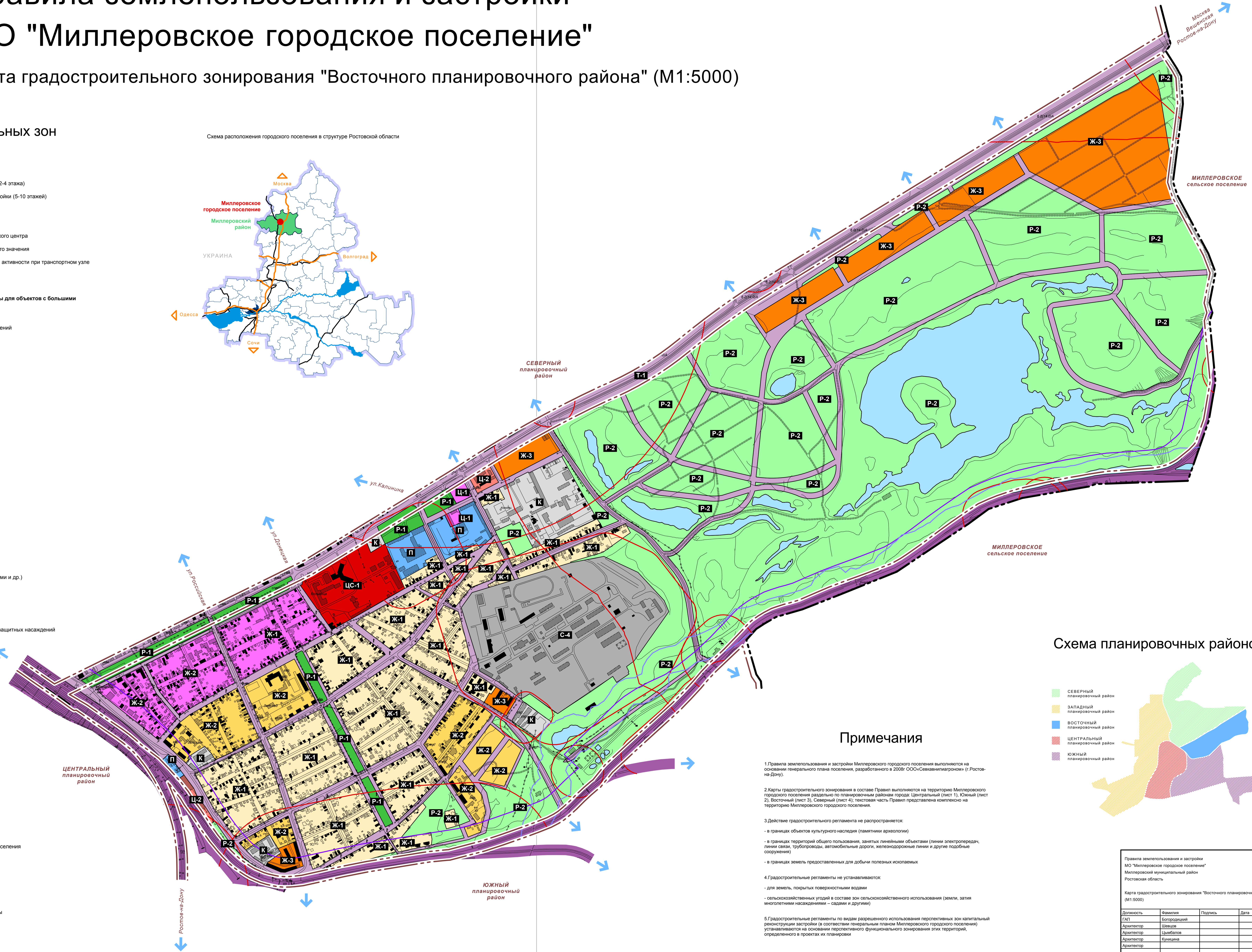
Схема планировочных районов