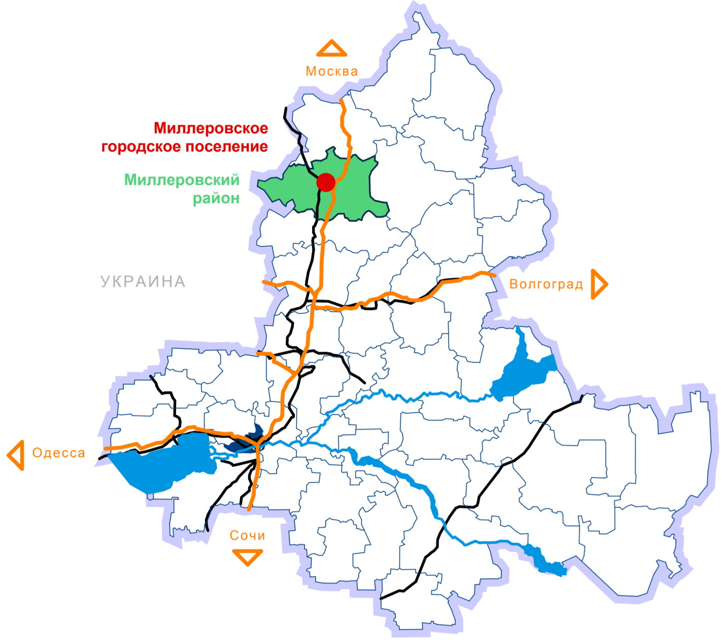
Схема планировочных районов

Схема расположения городского поселения в структуре Ростовской области