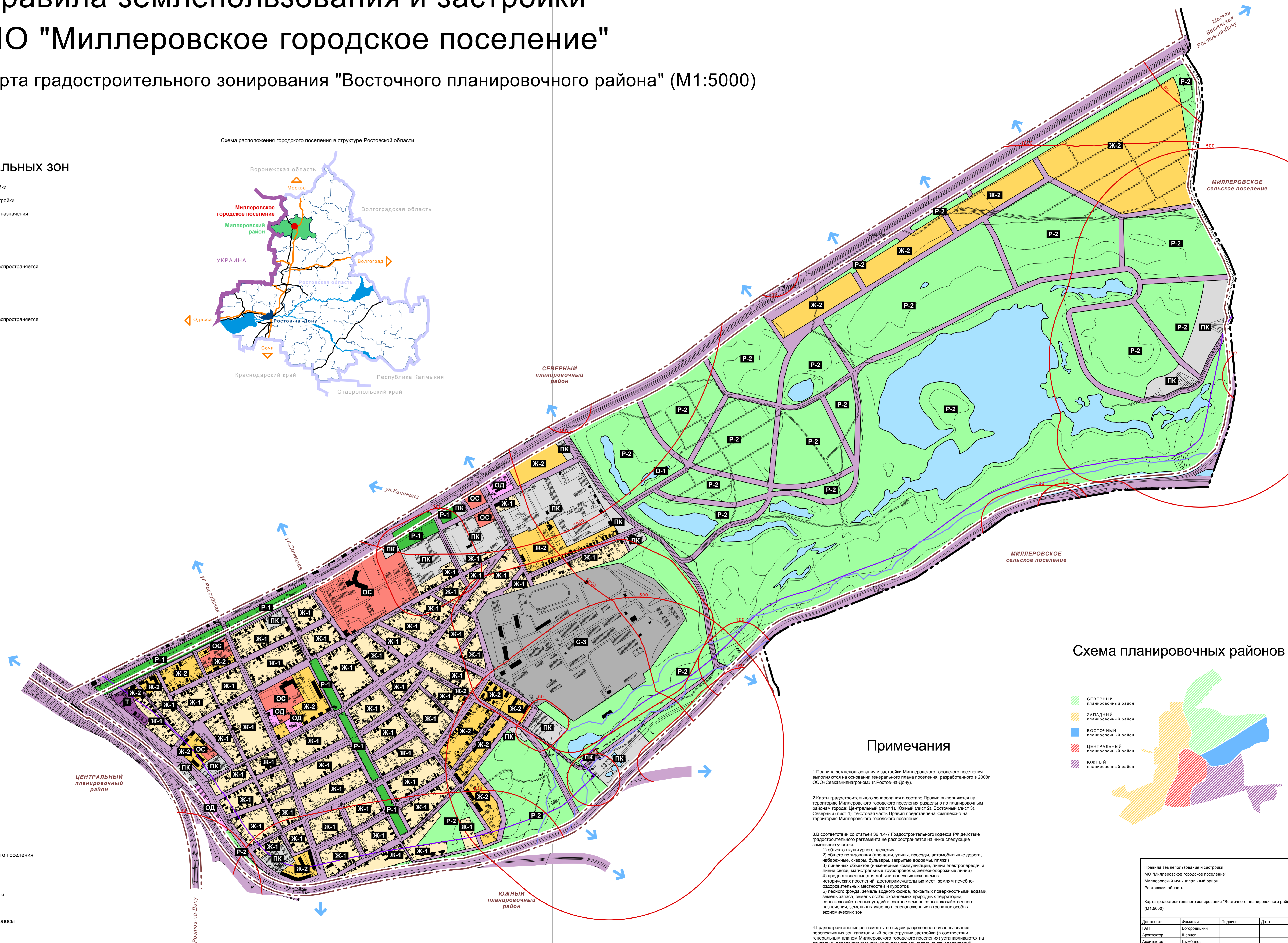
Схема планировочных районов