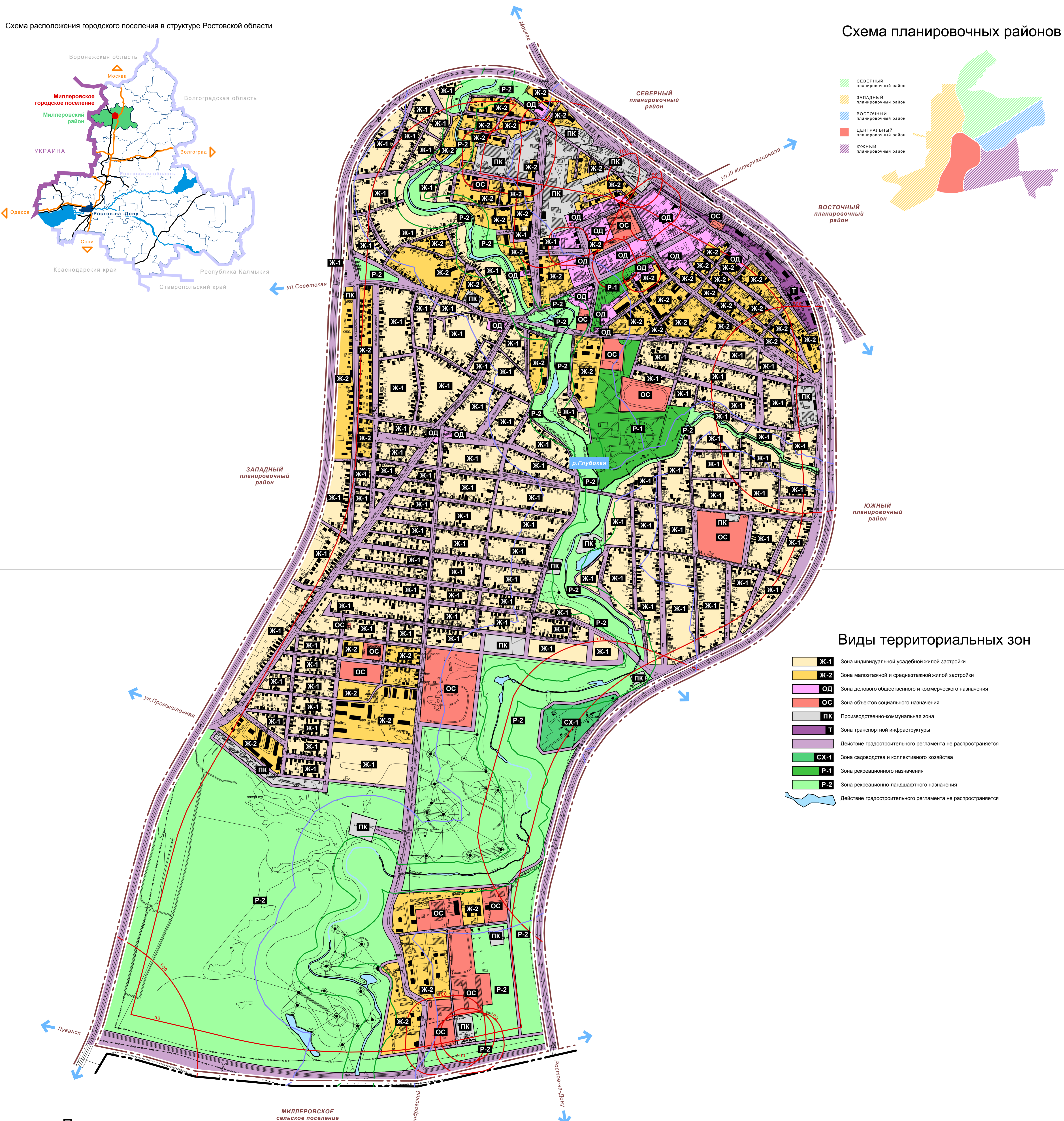
Виды территориальных зон