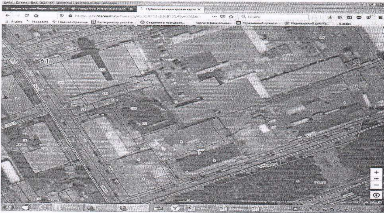
схема границ территории для подготовки проекта межевания территории в целях перераспределения земельного участка с кадастровым номером 61:54:0047501:1