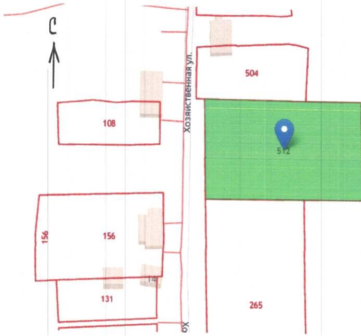
Схема расположения земельного участка с КН 61:54:0050001:512